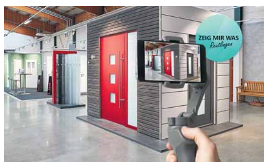
Präsentation mit der Smartphone-Kamera