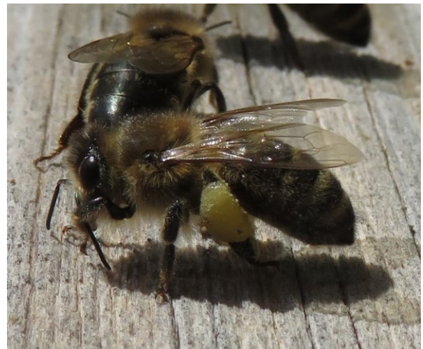
Die Biene putzt gerade ihre Fühler mit dem Vorderbein, damit sie wieder gut riechen kann.

Immer wieder putzt die Biene ihr Haarkleid mit den bürstenartigen Beinen und sammelt den Pollen an den Hinterbeinen. Dort hat sie Haftpolster aus Borsten, die den Pollen auf dem Transport zusammenhält. Diese Ansammlung nennen wir „Pollenhöschen“.